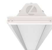
Marco de bisel